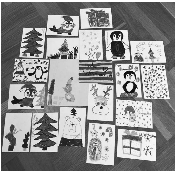
Selbstgestaltete Karten der Glücks-AG