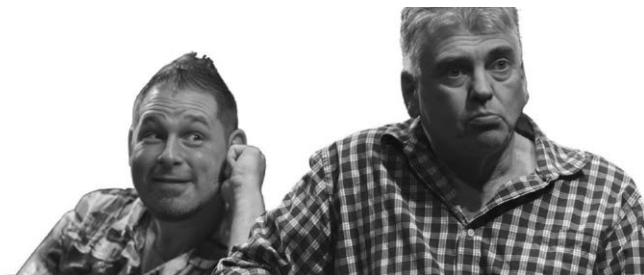
VVK 18 €, Online Ticketkauf, AK 20 €