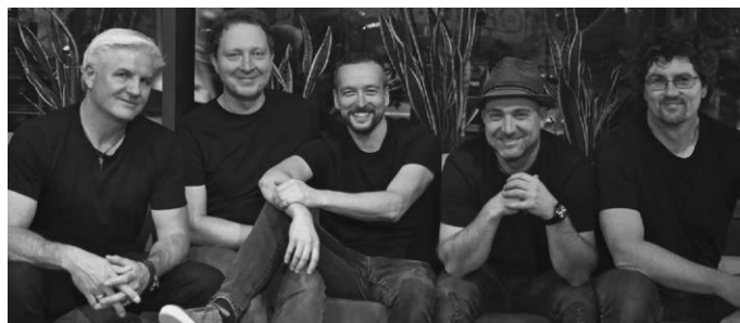
VVK 18 €, Online Ticketkauf, AK 20 €

Ticket-Kauf: VVK im Bürger-Service-Büro. Online Ticket-Kauf bei TICKET REGIONAL über www.muehle-ot.de . Ticket-Kauf per Telefon 0651-9790777. Restkarten an der Abendkasse.