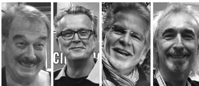
VVK 18 €, Online Ticketkauf, AK 20 €

Ticket-Kauf: VVK im Bürger-Service-Büro. Online Ticket-Kauf bei TICKET REGIONAL über www.muehle-ot.de . Ticket-Kauf per Telefon 0651-9790777. Restkarten an der Abendkasse.