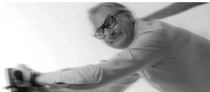
VVK 20 €, Online Ticketkauf, AK 22 €

Ticket-Kauf: VVK im Bürger-Service-Büro. Online Ticket-Kauf bei TICKET REGIONAL über www.muehle-ot.de . Ticket-Kauf per Telefon 0651-9790777. Restkarten an der Abendkasse.